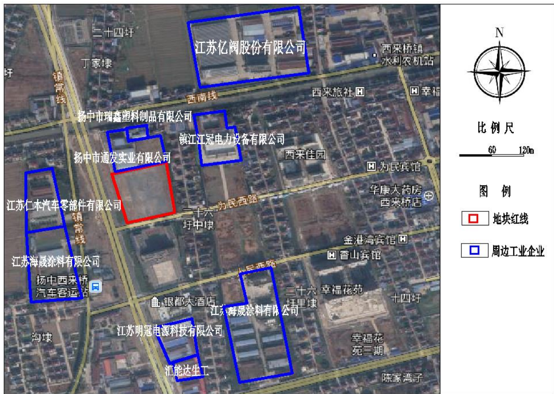
图 2-7 地块周边企业位置图

土壤样品现场快速检测：江苏地质基桩工程公司项目组成员于 2021 年 12 月 22 日对地块进行布点采样，以 XRF 和