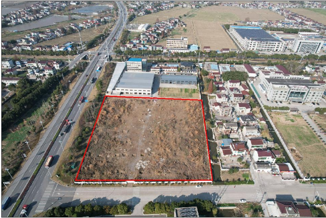
图 1-2 调查地块内现状图

人员访谈：通过对扬中市自然资源和规划局、扬中市自然资源和规划局西来桥服务中心、地块周边居民等相关人员的访谈得知，调查地块原为农田。调查地块历史上无工业企业生产经营活动，无化学品使用与储存，未发生过化学品泄漏或其他环境污染事件。地块周边 500m 范围内未发生过环境污染事件。